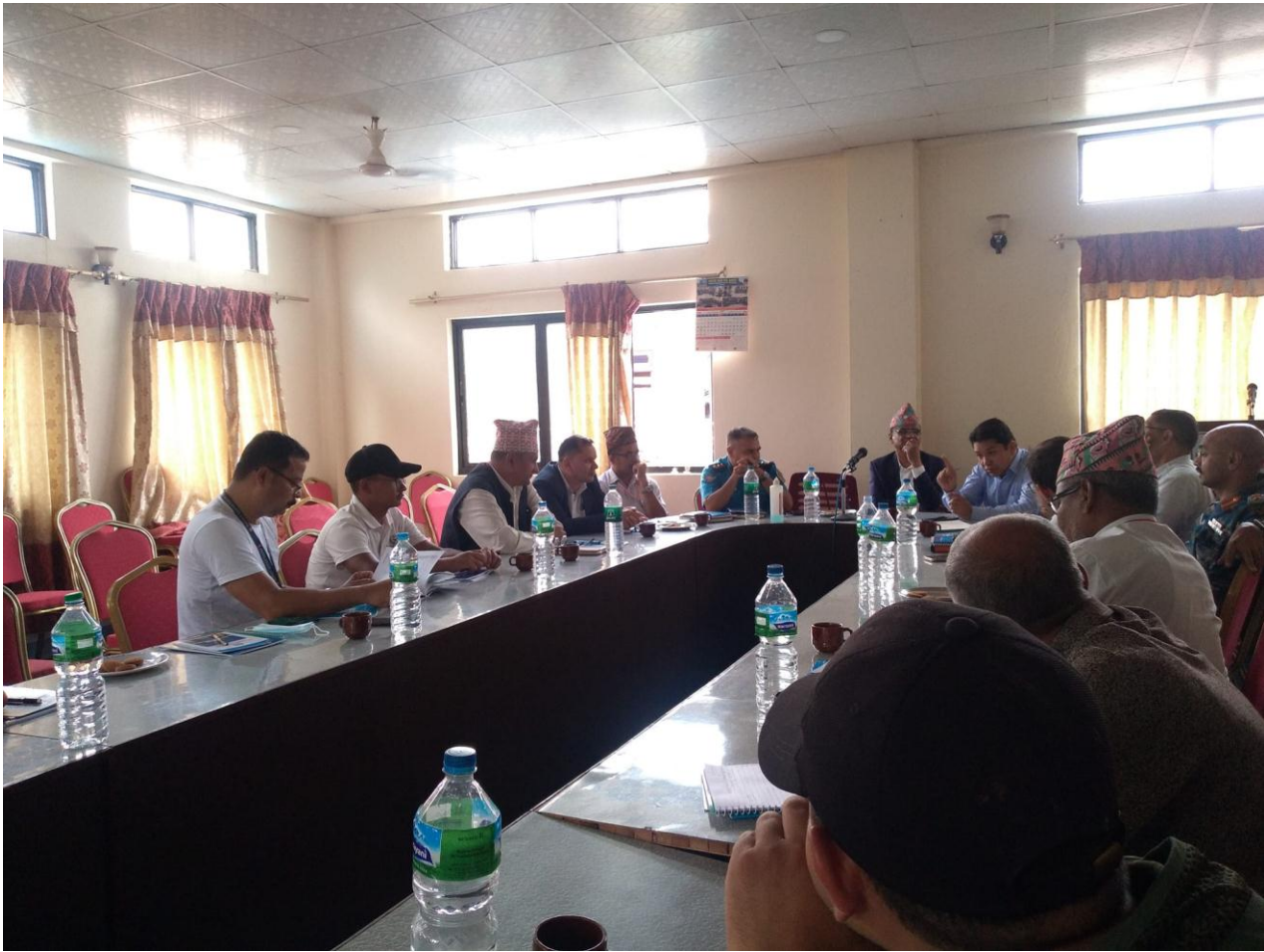
३. सुचना आयोग नेपालको आयोजनामा मिति २०८०/०३/२५ गते गरिएको कार्यक्रमको तस्विर