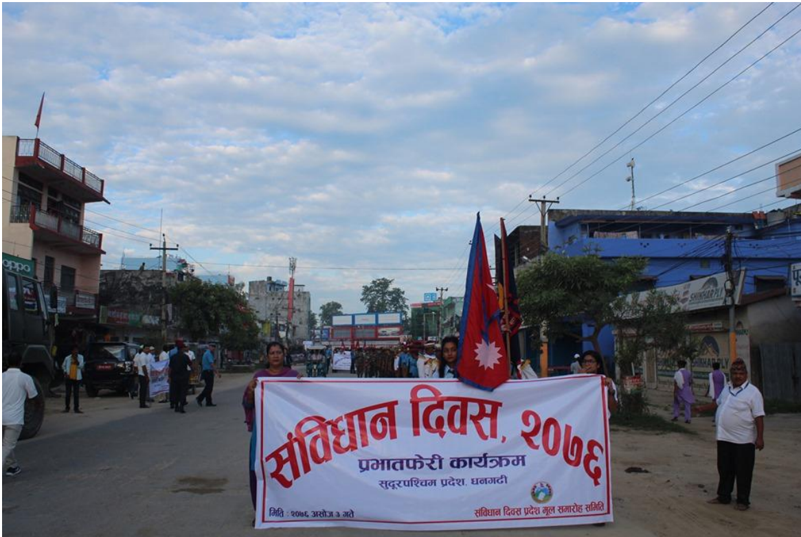
५. प्रजातन्त्र दिवसको अवसरमा गरिएको प्रभातफेरी कार्यक्रम